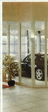
Porsche Zentrum Soest: Architektur für ein High-Tech-Produkt

Variable Podestfläche: Show-Bühne für die Fahrzeugpräsentation, aber auch für Modenschauen und andere Sonderveranstaltungen