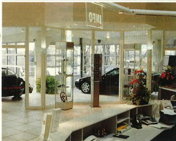
Blick von der Information zur Fahrzeugauslieferung