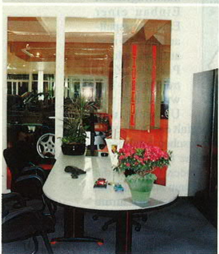
Verkäufers- büro, transpa- rent und diskret zu- gleich

dezent ‚begleiten‘ und dem Kunden ein angenehmes Gefühl vermitteln: Kein übertriebener Protz, keine unnötige Unterkühlung sind gefragt, sondern sympathisches Understatement.“