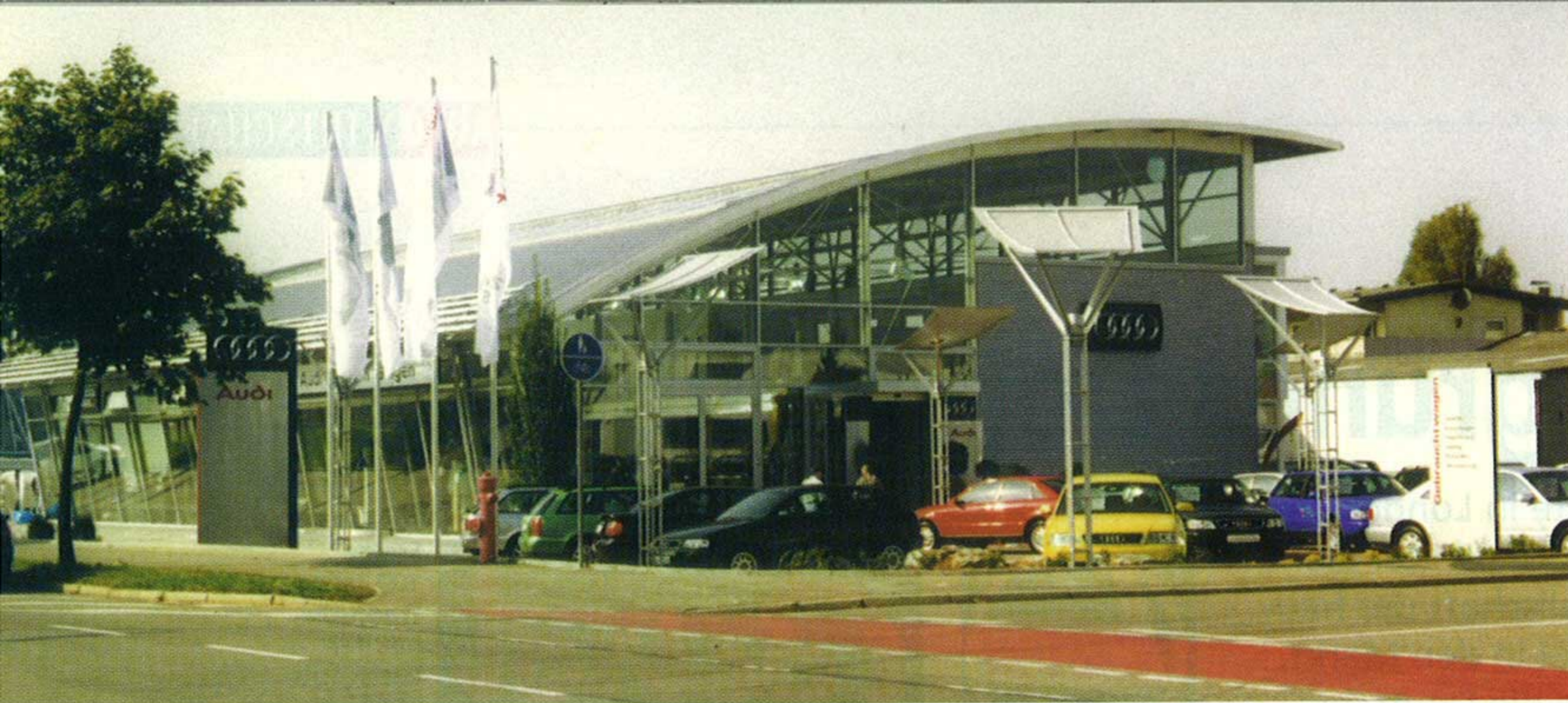
Das neue Audi Zentrum Singen an der 1,5 km langen Automeile Georg-Fischer-Straße